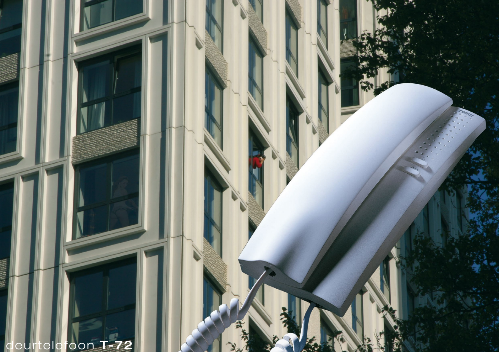
deurtelefoon T-72 videfoon M-72